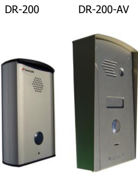
Surface/Flush Mount panel